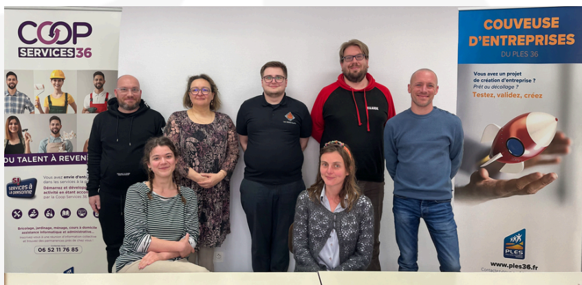
Formation en couveuse d'entreprises