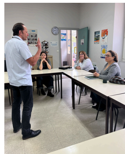
Atelier Coaching vocal le 21-03-2025

Oser pour réussir : rencontre avec le réseau Femmes des Territoires le 20/06/2025