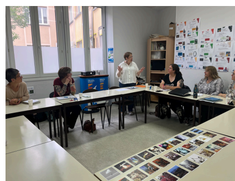
Atelier Image de soi le 06-06-2025

La couveuse, un outil adapté pour accompagner les femmes à franchir le pas et à gagner confiance en soi