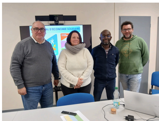
Formation "Créer et gérer sa microentreprise", décembre 2025

Le PLES a organisé en 2025, 2 sessions de formation "Couveuse", 2 sessions de pré-test et une formation "Valider son projet", des ateliers collectifs et une formation courte soit 770 heures-stagiaires (919 en 2024, 1069 en 2023 et 540 en 2022).