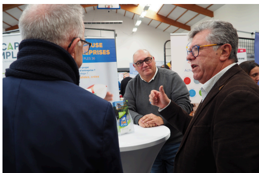
Participation du PLES au Village des entreprises de Chabris le 20-11-2025