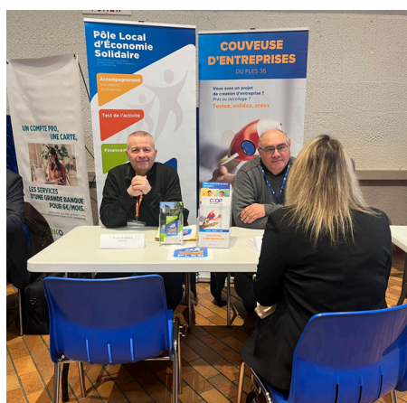
Présence du PLES au Forum Créa Boost à Belle Isle, organisé par la BGE Berry Touraine, en avril 2025

Le PLES a participé activement à divers évènements organisés par ses partenaires, et a invité 45 partenaires aux 17 commissions d'admission