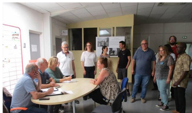
Les "Rendez-vous de l'entrepreneuriat" dans les locaux de la France Services de Valençay le 03-06-2025