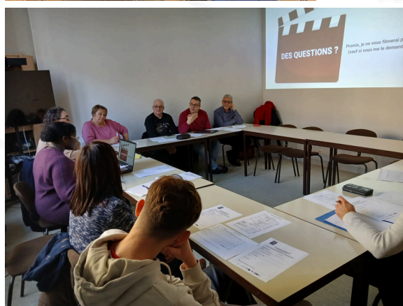
La commission d'admission de la Couveuse d'entreprises réunit régulièrement les partenaires du PLES