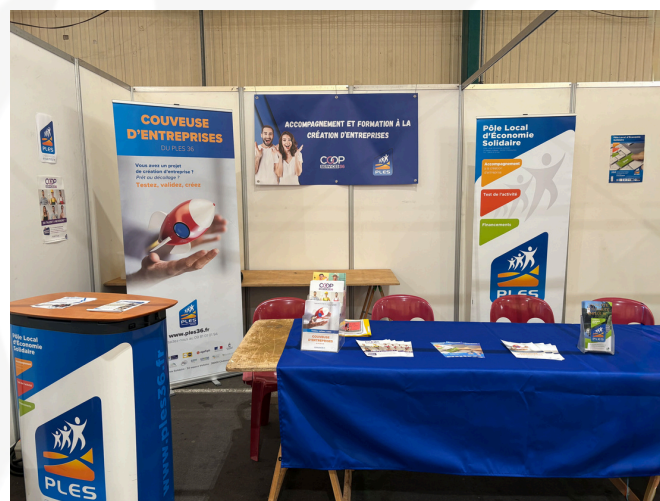
Stand du PLES au forum des associations